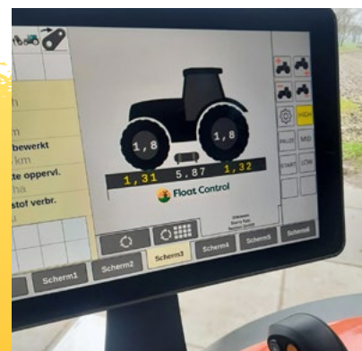
FCTL FORTGESCHRITTENES SYSTEM